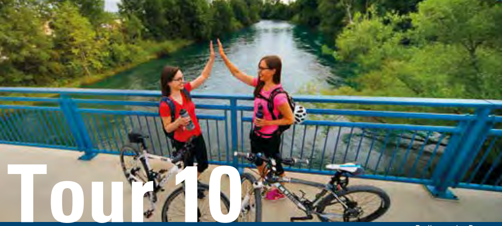
Radler an der Donau

Diese Tour verläuft nahezu ganz an Flüssen entlang und zeigt eine Fülle an Kultur- und Naturschönheiten. Durchs Schmiechtal, Heu- und Schandental fahren wir auf die Münsinger Alb. Dann rollen wir genussvoll bergab und gelangen hinüber ins Große Lautertal, eines der schönsten Täler der Schwäbischen Alb. Felsmassive, Burgruinen, Wacholderheiden und Wiesen säumen den Weg entlang der Lauter bis zur Mündung in die Donau. Dann folgen wir der Donau über Munderkingen und das Rottenacker Ried nach Ehingen. Bahnanschlüsse bestehen in Ehingen, Allmendingen, Schmiechen, Rottenacker und Munderkingen.