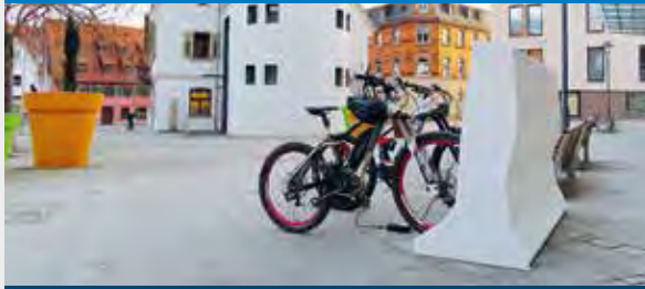
E-Bike Ladestation in Langenau