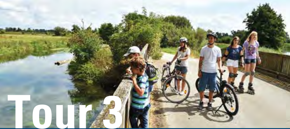
Im Langenauer Ried

Diese Rundtour ist durch starke landschaftliche Kontraste geprägt. Die stimmungsvolle Riedlandschaft mit langen Pappelreihen, Schilfgras, kleinen Wasserläufen und weiten Moorflächen beeindruckt dabei ebenso, wie das urgeschichtlich interessante Lonetal mit den Welterbehöhlen oder das Eselsburger Tal mit seinen Felsen und Wacholderheiden.