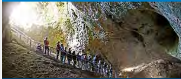
Sontheimer Höhle bei Heroldstatt