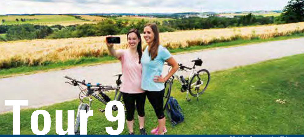
Blick ins Donautal bei Ehingen

Im Mittelpunkt dieser schönen und nahezu ebenen Tour steht die Donau. Von Ulm folgen wir dem Donauradweg flussaufwärts in Richtung Erbach. Vorbei an Seen und Wasserkraftanlagen und einer an Kunst und Kultur reichen Landschaft erreichen wir Ehingen. Nun zweigen wir ab ins wunderschöne Urdonautal und fahren über Blaubeuren zurück nach Ulm.