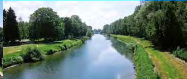
Donau bei Ulm