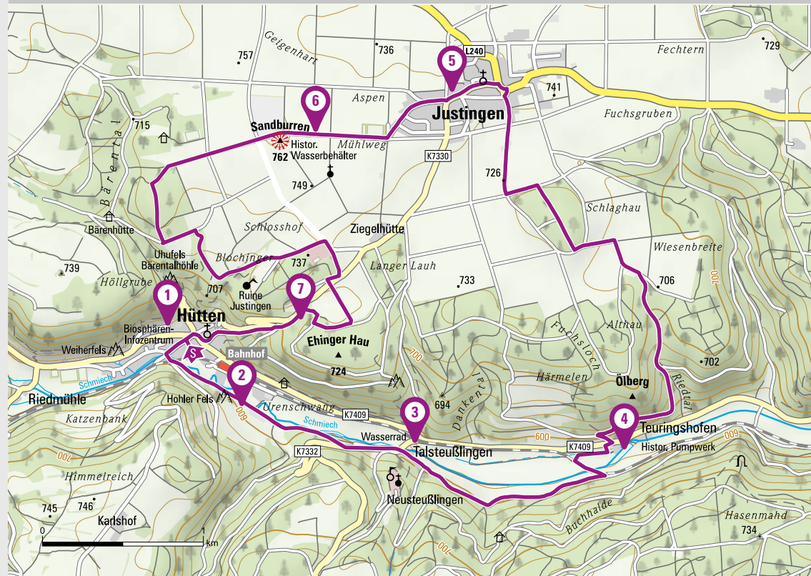
Pumpwerk bei Teuringshofen

Steige auf der alten Wegstrecke fuhren früher die Bauern mit Ochsenkarren das Wasser in Fässern auf die Alb